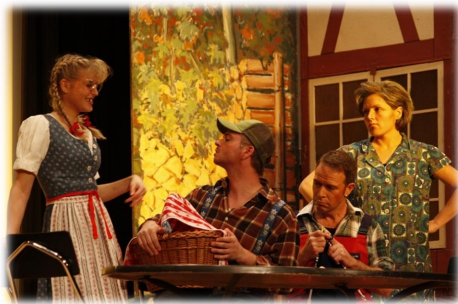
2014 Theatergruppe im Stück „Alpeluft und Muusgift“