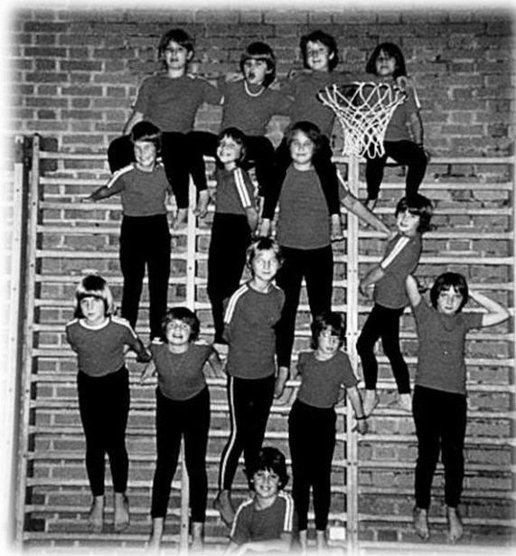
1982 Gruppenfoto Mädchenriege

von Trainingsplänen ist sinnvoll und die Trainings werden so optimal gestaltet.