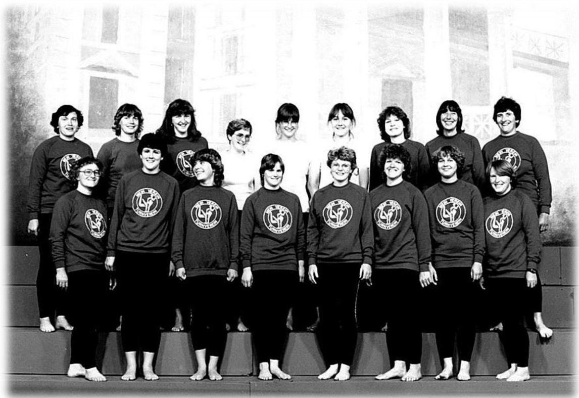
1984 SFTT Winterthur

Schweizerische Frauen Turntage (SFTT) und Eidgenössisches Turnfest (ETF) in Winterthur 1984. Für die Turnerinnen, endlich auch wieder unter fester Leitung, ein Muss, diesen Anlass zu besuchen und aktiv mit zu turnen. Dafür lässt man sogar den Stafettentag ausfallen und bezahlt den Mitturnenden am Weinländer keinen Beitrag. Lieber werden jeder Turnerin Fr. 50.-- für die Festkarte von Winterthur vergütet. Denn ein Eidgenössisches in so nächster Nähe, wann wird es das wieder geben?