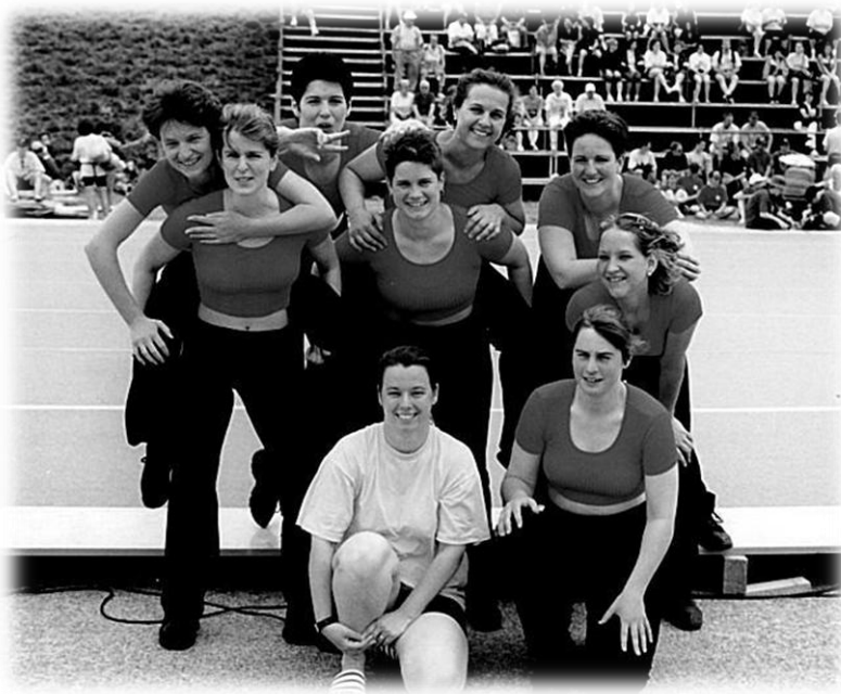
1999 KTF Dübendorf, Team-Aerobic

Ab 1999 starten wir zum ersten Mal an den Turnfesten in zwei verschiedenen Kategorien. Die Jüngeren bei den Aktiven wo neben Stufenbarren und Leichtathletik neu auch Team-Aerobic geturnt wird und die Älteren in der Kategorie Frauen mit den Disziplinen Allroundspiele, Kugelstossen und Schleuderball. Diese Aufteilung hat sich bewährt und wird auch künftig so beibehalten.