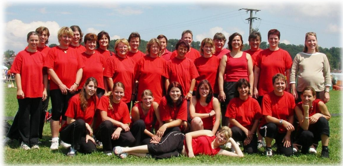
2005 KTF Wiesendangen

In Wiesendangen findet das Kantonale Turnfest statt, an welches wir bequem mit dem Postauto reisen.