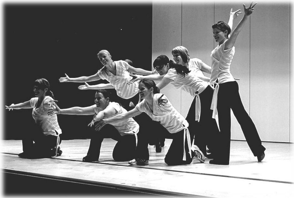
2008 Einweihung des neuen Bühnenanbaus

So schön, da staunt der Bürger. Die erste Abendunterhaltung in der neuen Halle mit einer grösseren Bühne. Die Aufführungen und das Theater finden einen riesen Anklang. Von nun an wird das Ganze auch nur noch an einem Wochenende – Freitag- und Samstagabend - durchgeführt und die Einnahmen können trotzdem gesteigert werden. Pro Abend können wir nun doppelt so viele Besucher bewirten, welche neu auch von einer Kaffee- und Kuchen-Ecke, der traditionellen Tombola und der Bar im Schulhausgang profitieren können.