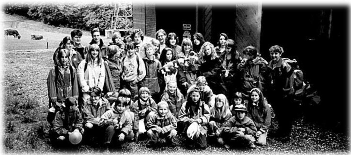
1993 Mädchenriegenreise Pizol

Die diesjährige Mädchenriegenreise führt auf den Pizol.