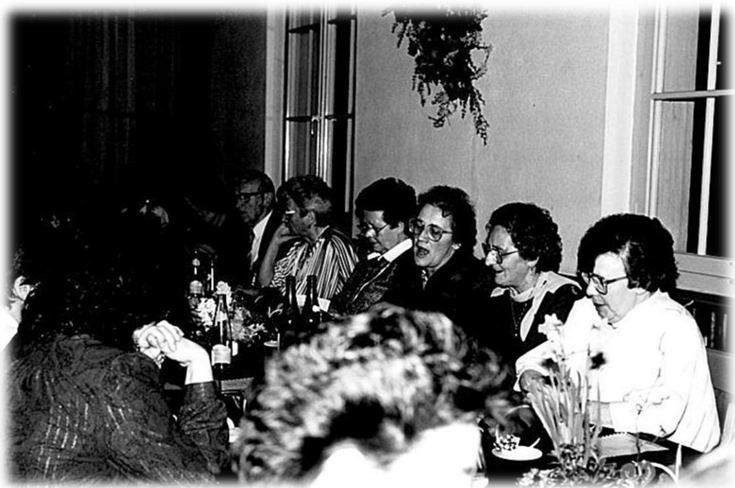
1990 Jubiläum im Gemeindesaal

Mitglieder: im Jahr 1990 werden 37 Aktive und 15 Volleyballerinnen gezählt. Die Präsidentin erwähnt im Jahresbericht das Jubiläum und hofft auf weitere erfolgreiche 25 Jahre.