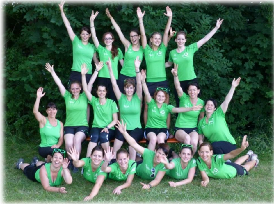
2013 Aktive am ETF in Biel

Im Juni findet das Eidgenössische Turnfest in Biel statt, welches leider von schweren Stürmen überschattet wird. Auch aus unserer Riege müssen Turnerinnen evakuiert werden – sie bleiben aber zum Glück unverletzt.