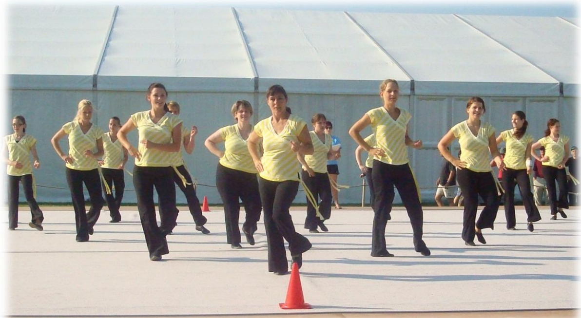
2010 Turnfest Maienfeld, Gymnastik Bühne

Bündner Herrschaft chauffiert und können den Wettkampf pünktlich um 7.30 Uhr beginnen.