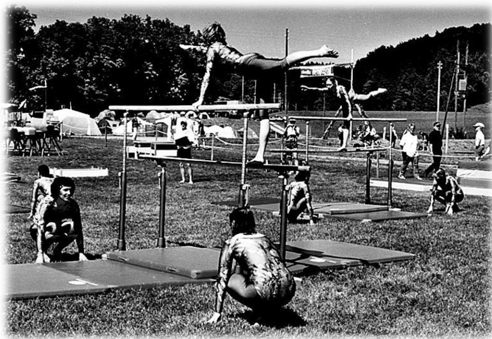
2002 ETF Basel, Stufenbarren

Die Teilnahme am Eidgenössischen Turnfest im Baselbiet bietet einen weiteren Höhepunkt in diesem Jahr.