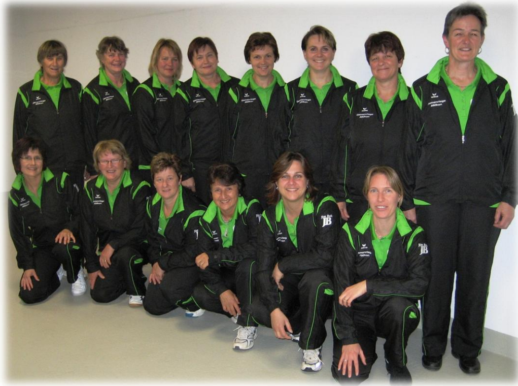
2008 Frauenriege im neuen Trainer