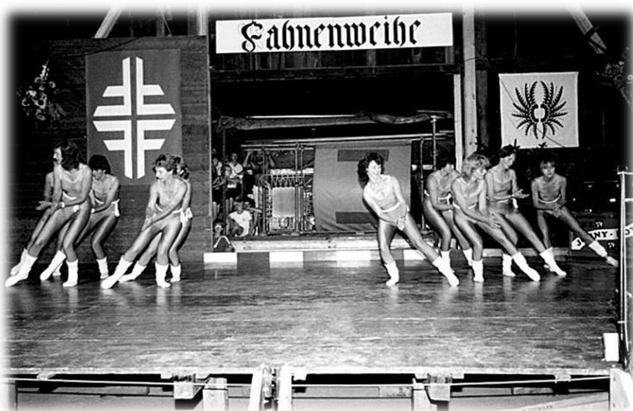
1985 Fahnenweihe- Aufführung Damenriege

Mit diversen Aufführungen und der Mithilfe im OK und in der Festwirtschaft beteiligt sich die Frauen- und Damenriege an diesem schönen Fest.