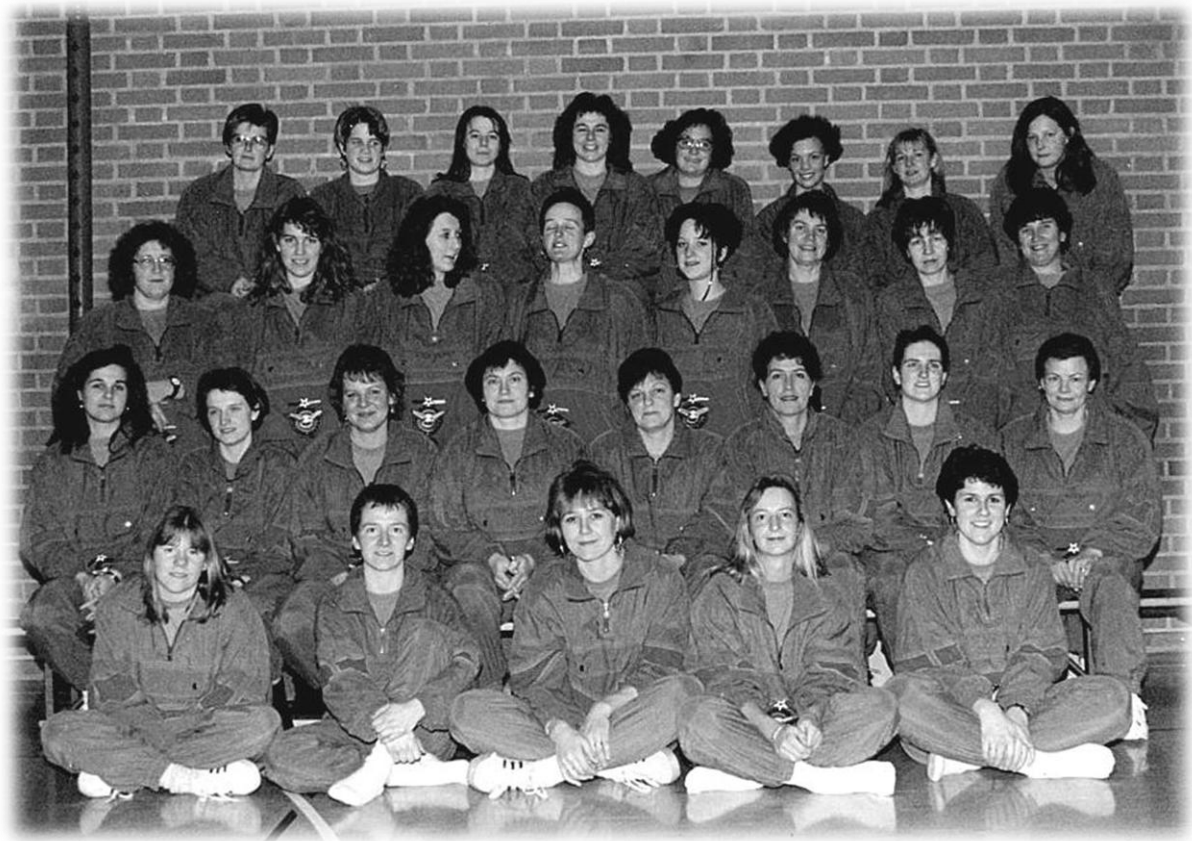
1994 Gruppenfoto im neuen Trainer

Erstmals nehmen wir an einem Ausserkantonalen Turnfest teil und reisen nach Küssnacht am Rigi.