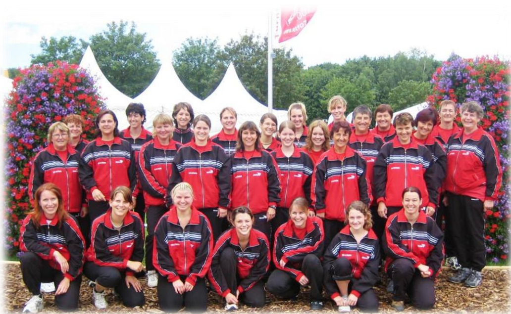
2007 ETF Frauenfeld

Das Eidgenössische Turnfest in Frauenfeld; wieder einmal ganz nah von zu Hause. Fast selbstverständlich, dass man da hinget, egal, ob als Wettkämpfer oder als Zuschauer. Nach einem schönen Fest treten einige die Heimreise dann sogar mit dem Boot auf der Thur an.