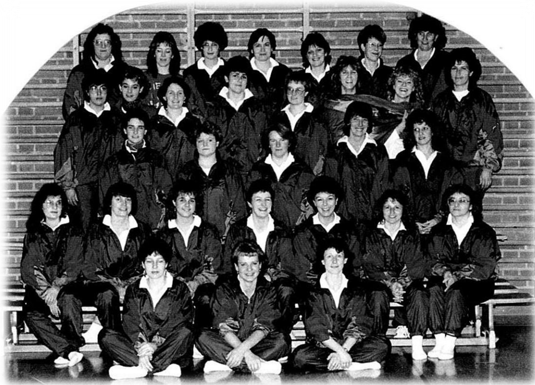
1988 Gruppenfoto im neuen Trainer

Die Volleyballerinnen steigen in die 1. Liga des Kantonaltornverbandes auf.