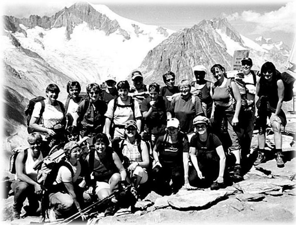
2003 DR Reise Eggishorn

Abkühlen können wir uns dann auf der Damenriege Reise welche uns aufs Eggishorn führt.