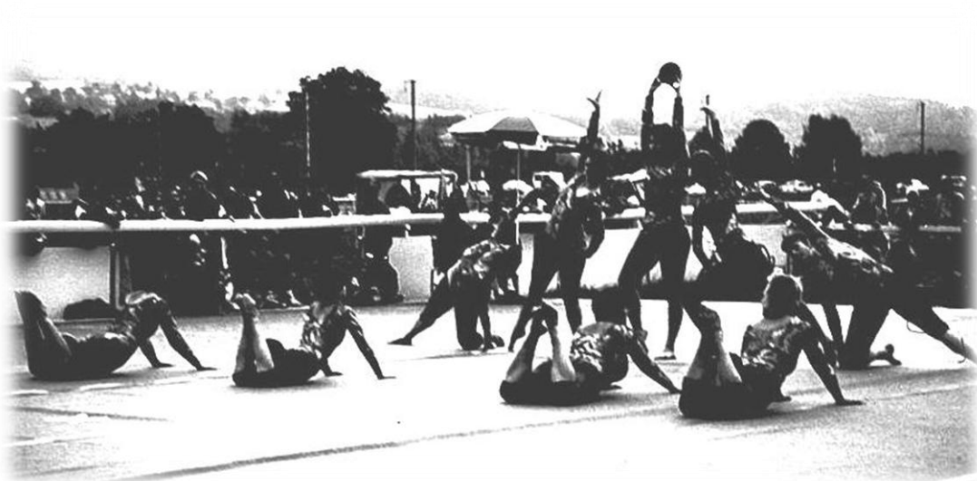
1998 VTF Fehraltorf, Kür mit Ball und Tambourin

Am Verbandsturnfest in Fehraltorf starten wir mit einer Gymnastik mit Ball + Tambourin.