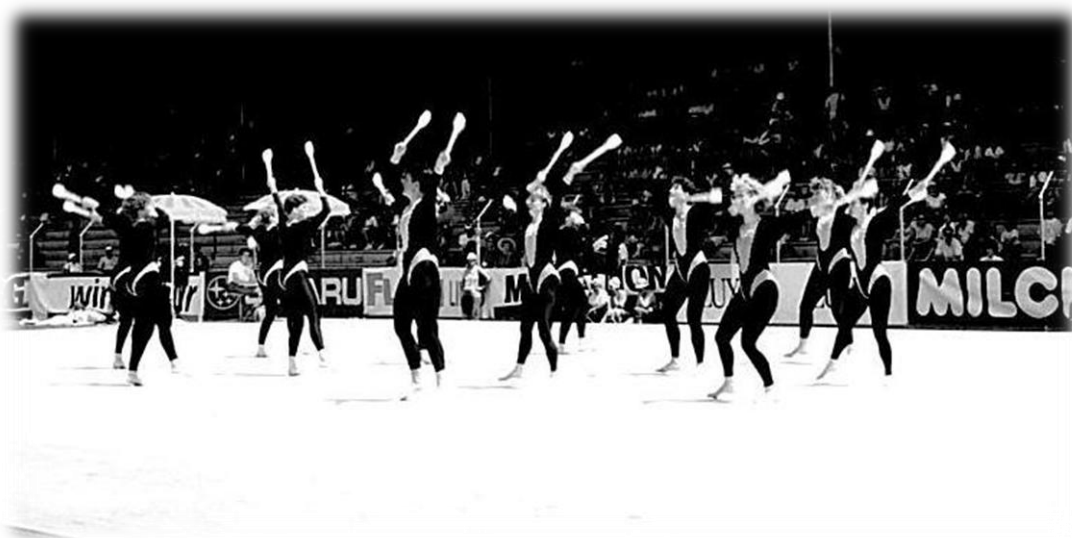
1991 ETF Luzern, Keulenkür

Der Besuch des Eidgenössischen Turnfestes in Luzern wird gutgeheis- sen. Die Bezahlung der Festkarten durch den Verein, bringt das Bud- get jedoch etwas durcheinander, denn die Festkarten plus Startgelder kosten über Fr. 2'000.--. Nun muss wieder Geld verdient werden!