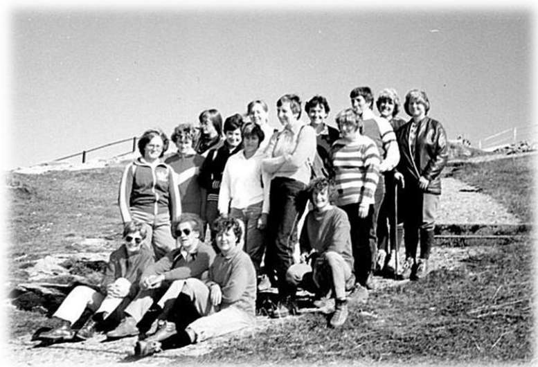
1983 Reise auf die Rigi

Die Turnerinnen möchten sich am Schlussturnen auch gerne in einem eigenen Wettkampf messen und somit wird das Programm durch die Disziplinen der Damenriege ergänzt. Man wählt: Stufenbarren, Mini-tramp, Froschhupf, Kugelstossen und 80m Lauf. Die Bedingung ist jedoch, dass die Mitturnenden trotzdem ihren Einsatz im Arbeitsplan einhalten müssen. Später kommt dann sogar ein Wanderpreis ins Spiel.