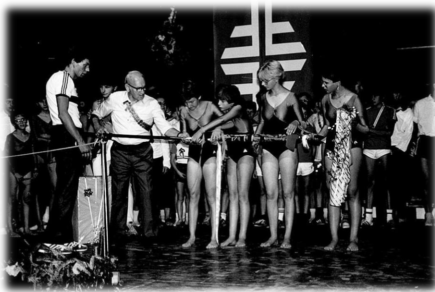
1985 Fahnenweihe – Fahnenenthüllung durch die Mädchenriege

der Fahnenweihe des TV und der Jugi durchgeführt. Das ganze Dorf ist im Festfieber und Altikon eine einzige Festhütte!